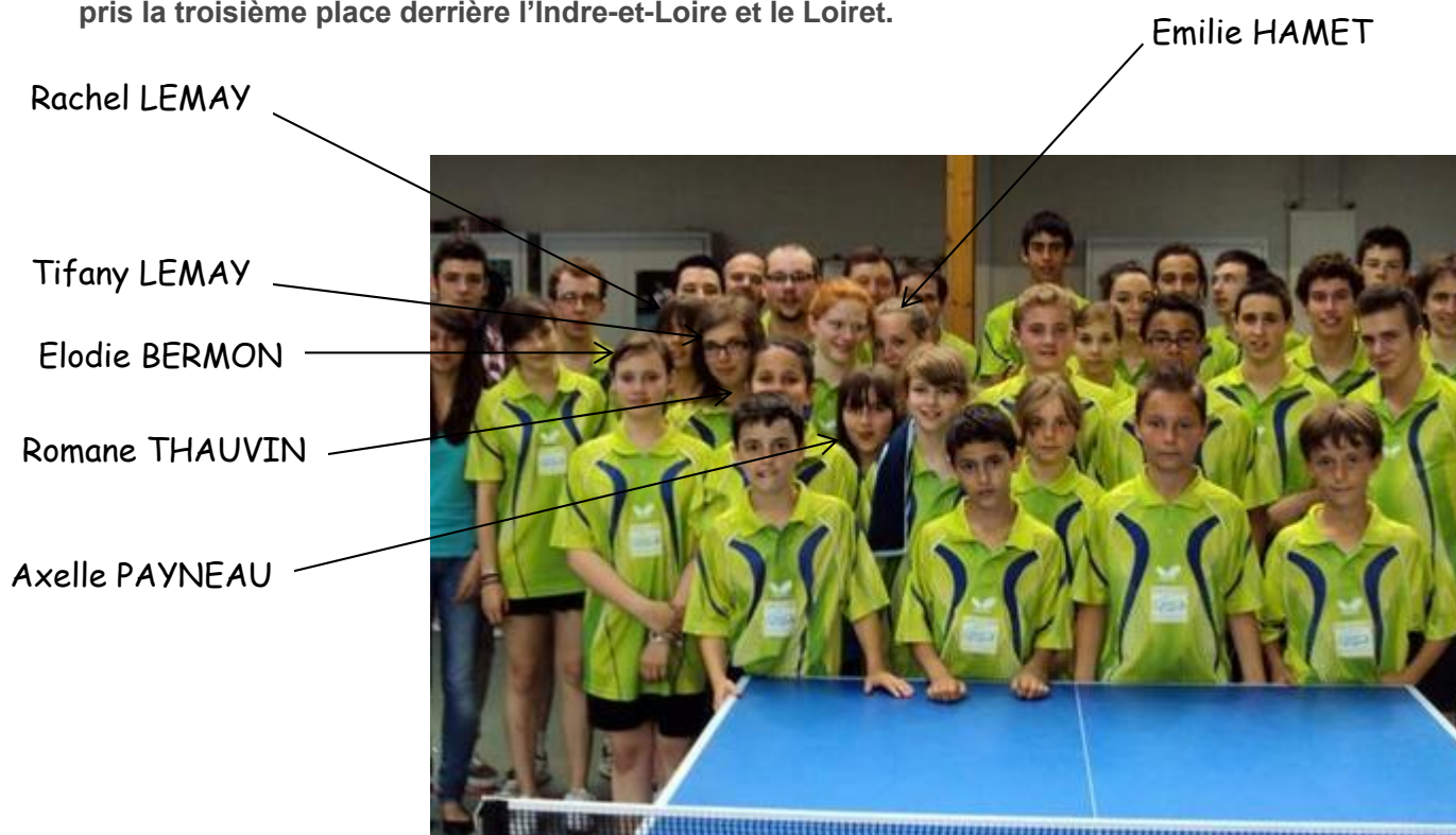
La sélection du Loir-et-Cher s'est bien comportée dans l'Eure-et-Loir.

Les pongistes loir-et-chériens se sont remarquablement signalés lors des inter-comités. Ils ont pris la troisième place derrière l'Indre-et-Loire et le Loiret.